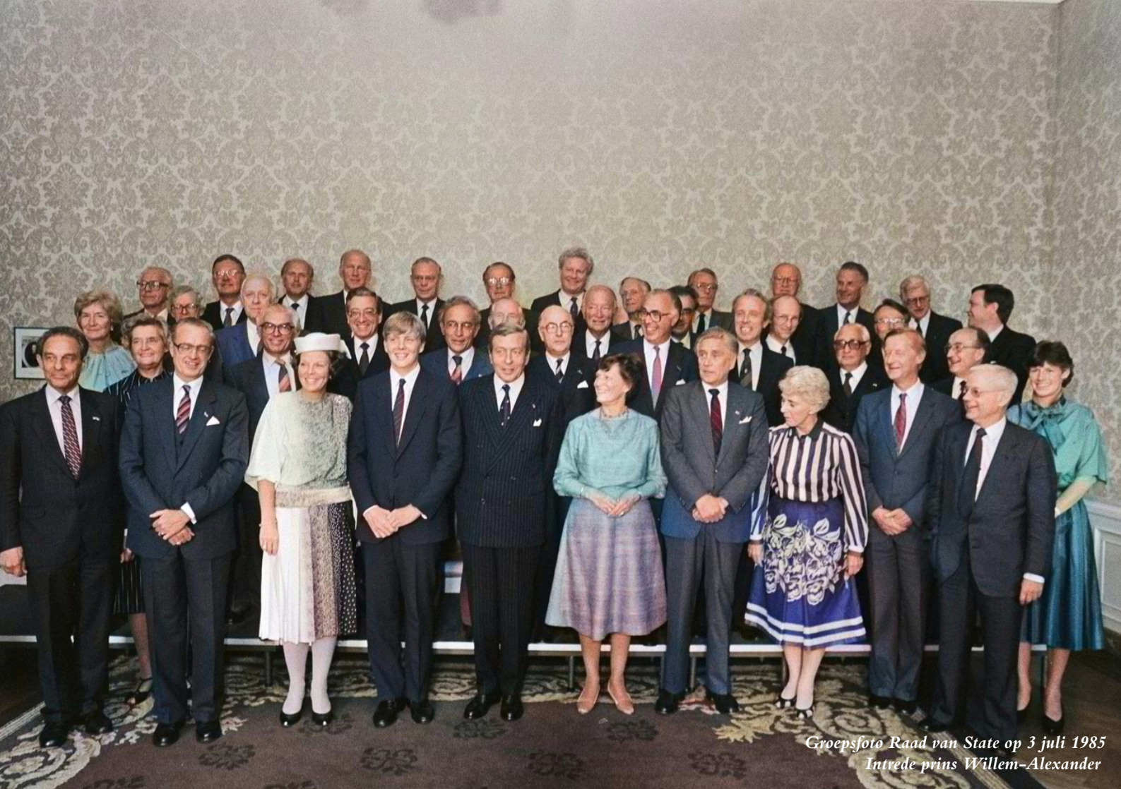
Groepsfoto Raad van State op 3 juli 1985 Intrede prins Willem-Alexander